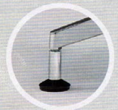
Elegante Gleiter mit Aluminiumdistanzstück